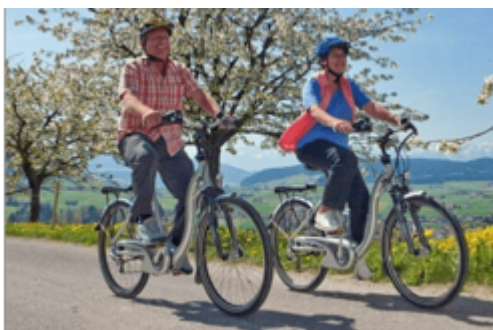
€ 180,00 pro Person/Aufenthalt