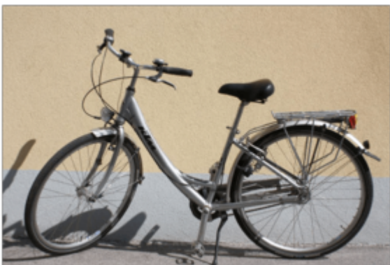
€ 80,00 pro Person/Aufenthalt