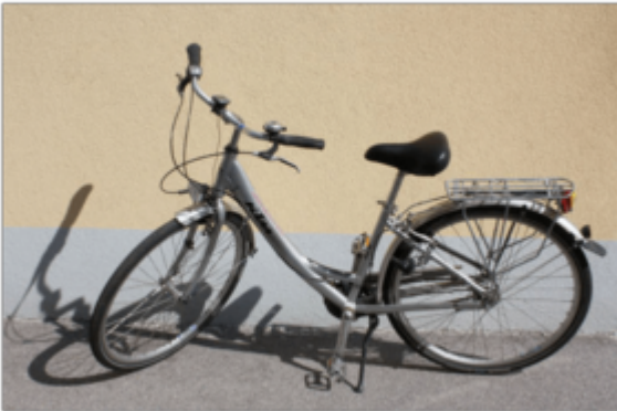
€ 80,00 pro Person/Aufenthalt