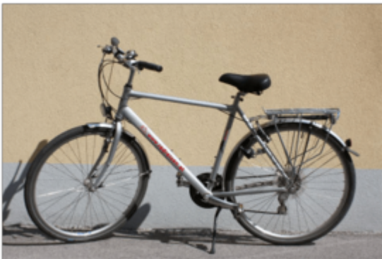
€ 80,00 pro Person/Aufenthalt